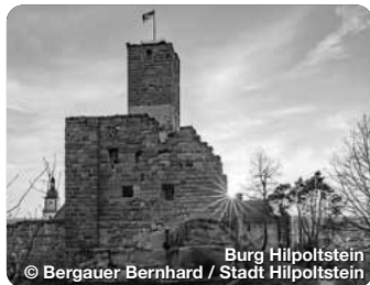
Burg Hilpoltstein